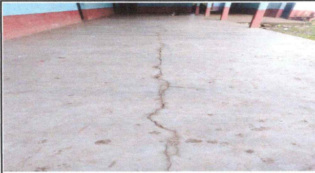
Foto 1: En el corredor de centro educativo se observa el deterioro del piso.