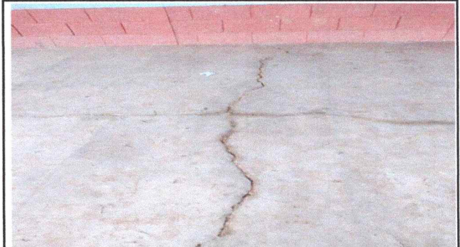
Foto 2: El piso se esta deteriorando en el area del centro educativo.